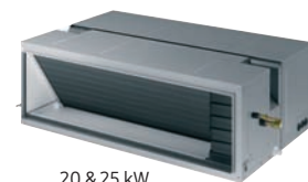
20 & 25 kW